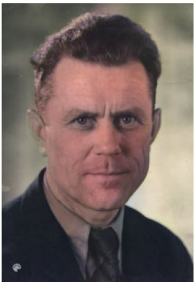
Kilde: Dansk Wikipedia (computerfarvelagt)

Homme politique (communiste, puis fondateur du parti socialiste).